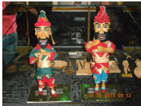
Museu Karagöz & Hacivat.