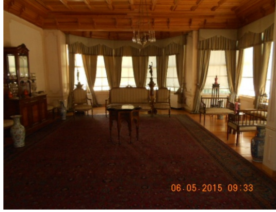
Uma das casas onde viveu Ataturk – vista exterior e interior.