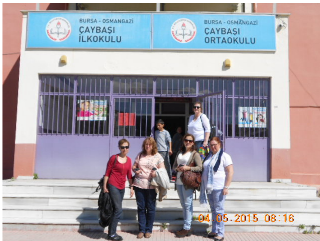
As professoras do projeto em Bursa – Osmangazi